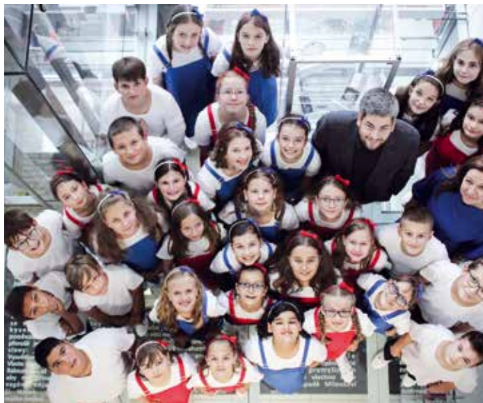
Koncertní sbor Permoník.