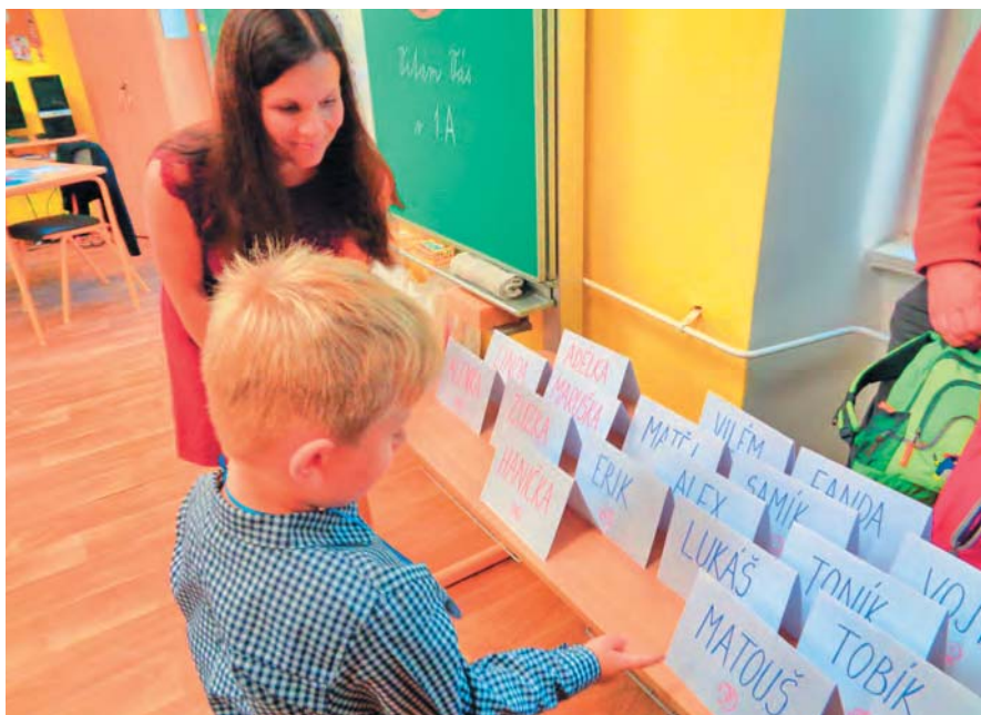
Vítej ve škole.

Vyučování ve školním roce 2022/2023 začne ve všech základních školách, středních školách, základních uměleckých školách a konzervatořích ve čtvrtek 1. září.