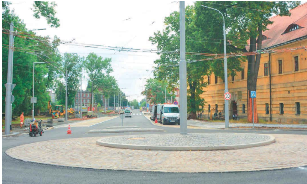
Postup prací při přestavbě křižovatky a přestupního uzlu u Fortny i opravě Moravského mostu umožňuje návrat třinácti linek MHD na původní trasu. Řidiči osobních aut si na tuto možnost budou muset počkat do přelomu letošního a příštího roku.

Trolejbusové linky projíždějící tímto místem budou zatím