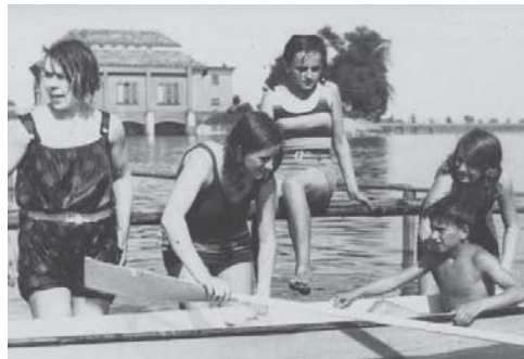
Takhle vypadala velice oblíbená Slezská plovárna ve třicátých letech 20. století.