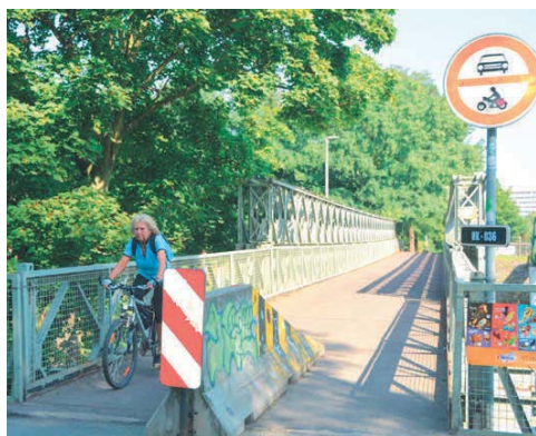
Most Bailey Bridge mezi Malšovicemi a Slezským Předměstím, který čeká opravu, je využíván pěšími a cyklisty.

Ocelový most Bailey Bridge, pro který se vžil pojmenování Klapák, bude od počátku září až do jara příštího roku uzavřen. Důvodem je jeho celková oprava, kterou bude zhotovitelská firma provádět rozebráním tělesa mostní konstrukce. Most spojující oba břehy řeky Orlice mezi Malšovicemi a Slezským Předměstím je využíván pěšími a cyklisty, kteří budou muset po dobu uzavírky k přechodu nebo přejezdu na druhý břeh využívat mosty Orlický nebo ve Svinarech. Britský vojenský most Bailey Bridge byl vyroben v roce 1944, má délku 36 metrů a v Hradci stojí od roku 1947. // red