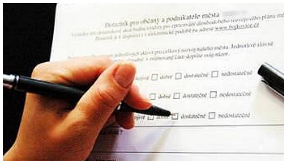
Ilustrační foto.

Během září 2022 až července 2023 bude v Liberci, České Lípě, Jablonci nad Nisou, Tanvaldu, Jilemnici, Harrachově, Lučanech nad Nisou a dalších vybraných obcích probíhat prestižní Mezinárodní výzkum dospělých PIAAC, který pořádá Organizace pro hospodářskou spolupráci a rozvoj (OECD).