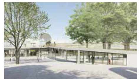
Terminál Černý Most