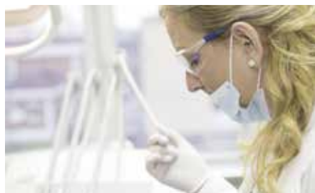
Kampaň: Praha 14 bez kazu 16–17