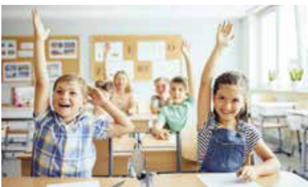
Zápisy do škol a školek